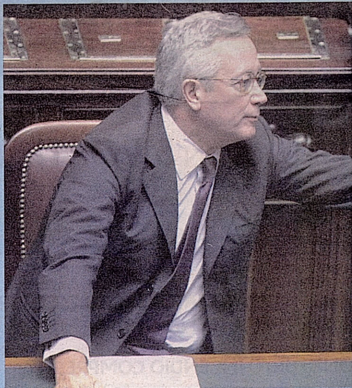
Giulio Tremonti, ministro dell'Economia, in Parlamento

Le perplessità di sindaci, politici, per commercianti, sindacati e imprese: c